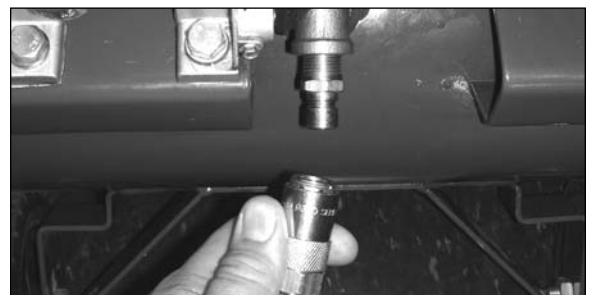
Step / Étape / Paso 4