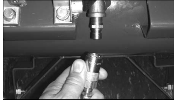
Step / Étape / Paso 1

Replace knob into large tank for storage.