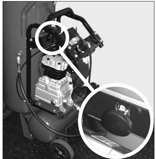
Step / Étape / Paso 2

Replacer le bouton sur le large réservoir pour son entreposage.