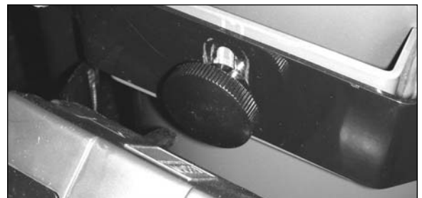
Step / Étape / Paso 3