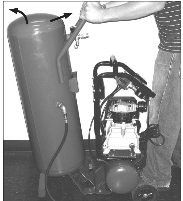
Step / Étape / Paso 2